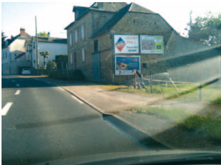
périph/tulle-25 (en bas)